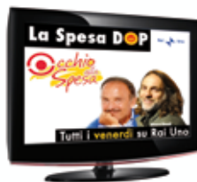
La Spesa DOP - Rai Uno