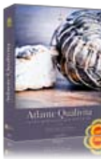
Atlante Qualivita 2011