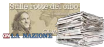
Sulle rotte del cibo - La Nazione